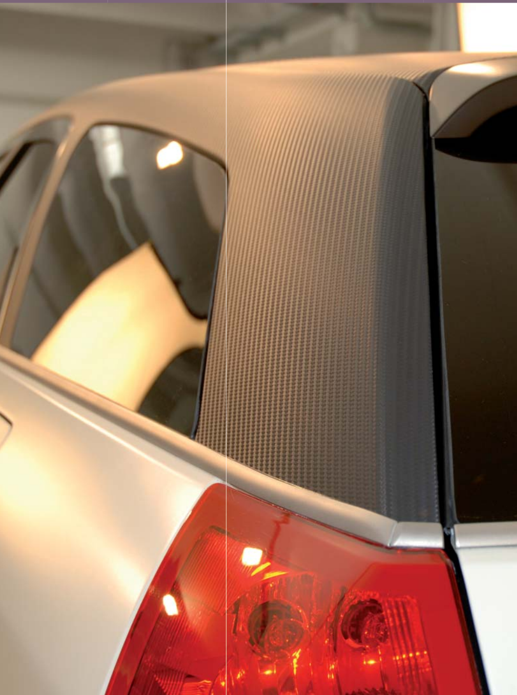
Rivestimento integrale di parti esterne.